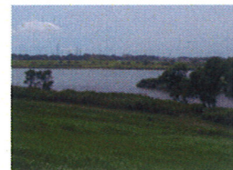
【出発地点】 利根町布川の 利根川と小貝 川の合流点

【第1日目】平成23年11月12日 (土) 集合: 取手駅南口/大利根駅交通(株)バス停 8:30AM 到着: 関東鉄道/新取手駅 15:30PM 予定