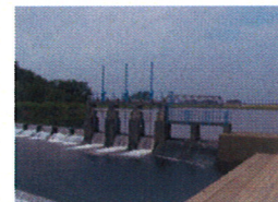
【到着地点】 筑西市の村田 堰とJR水戸線 鉄橋

【第5日目】平成24年5月19日 (土) 集合: 関東鉄道/大宝駅東広場 8:52AM 到着: 関東鉄道/下館駅 15:12PM 予定